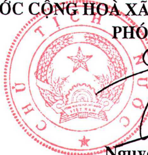
Nguyễn Thị Doan

KT. CHỦ TỊCH NƯỚC CỘNG HÒA XÃ HỘI CHỦ NGHĨA VIỆT NAM PHÓ CHỦ TỊCH